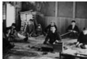
農閑期を利用して、若者が納屋に集まり、自家生産のわらで縄、俵などを作りました。