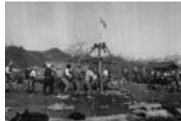
石場つきは、家を新築する際、柱の礎石を据えるために行った作業です。

古い写真は、当時の暮らしや風景がわかるだけでなく、その時代に生きた人々の気持ちや生き方までもが伝わってきます。この企画展は3月31日まで開催しておりますので、ぜひご家族お揃いでお越しいただき、古き良き故郷を若い世代に語り継いでいただきたいと思っております。