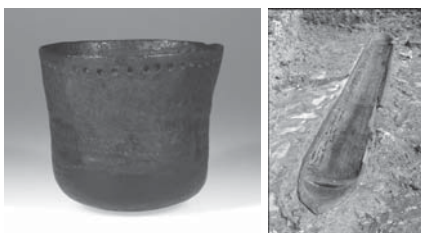
鳥浜貝塚斜格子沈線紋土器 とユリ遺跡1号丸木舟

このように水月湖年縞は、より正確な遺物の年代を突き止めるのに役立っています。較正された年代値は縄文博物館の常設展示室でご覧いただけます。