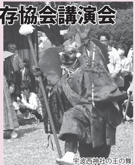
宇波西神社の王の舞